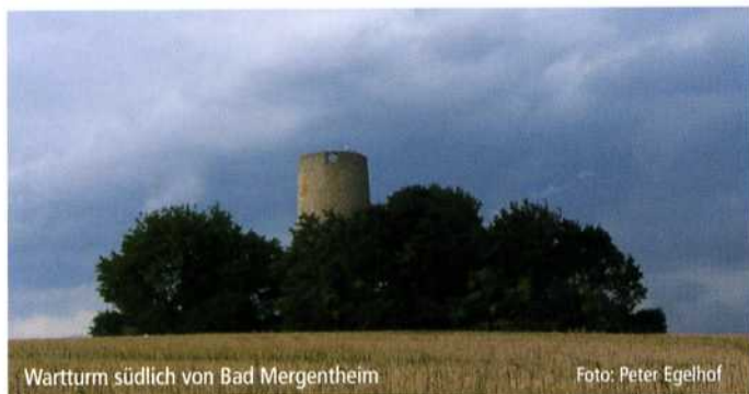
Wartturm südlich von Bad Mergentheim

Bei den beiden Linden auf der Höhe geht der Weg rechts ab zum schon sichtbaren und bestiegbaren Wartturm. Er war Ausguck und Wachturm der Stadt.