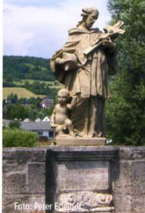
Tauberbrücke in Igersheim